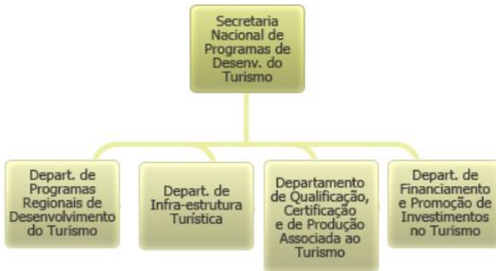
Figura 1 – Organograma da SNPDTur

A Secretaria Nacional de Programas de Desenvolvimento do Turismo tem em sua estrutura quatro diretorias, são elas: Departamento de Infraestrutura Turística DIETU; Departamento de Programas Regionais de Desenvolvimento do Turismo DPRDT; Departamento Financiamento e Promoção de Investimentos no Turismo DFPIT e Departamento de Qualificação Certificação e de Produção Associada ao Turismo DCPAT.